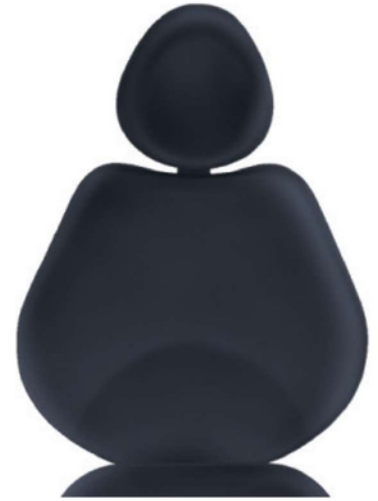
PVC (AZUL MARINO) Ref. 1600000170639