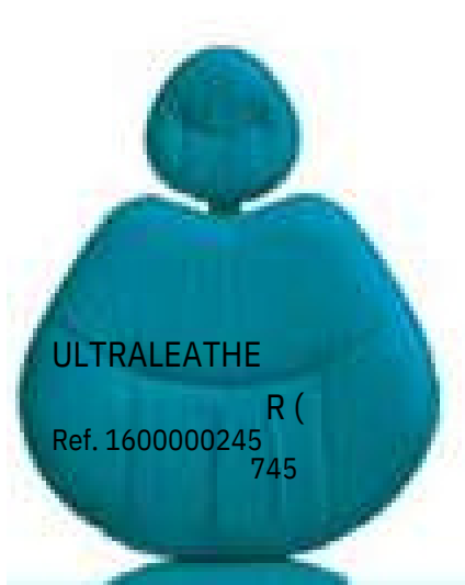
ULTRALEATHE R ( Ref. 1600000245 745