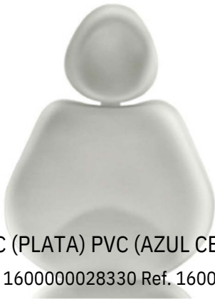
PVC (PLATA) PVC (AZUL CELESTE) HOLOGRAFICO (AZUL CLARO) Ref. 1600000028330 Ref. 1600000029238 Ref. 1600000031343