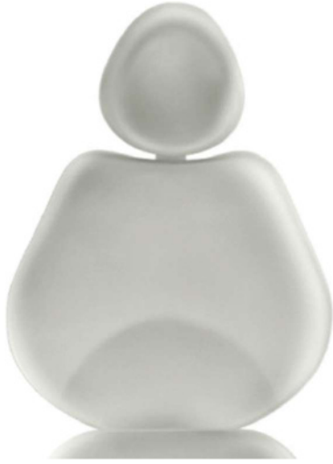
PVC (PLATA) Ref. 1600000169730