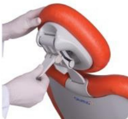
Apoyo cabeza biarticulado