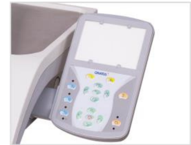
Panel de Comando PAD