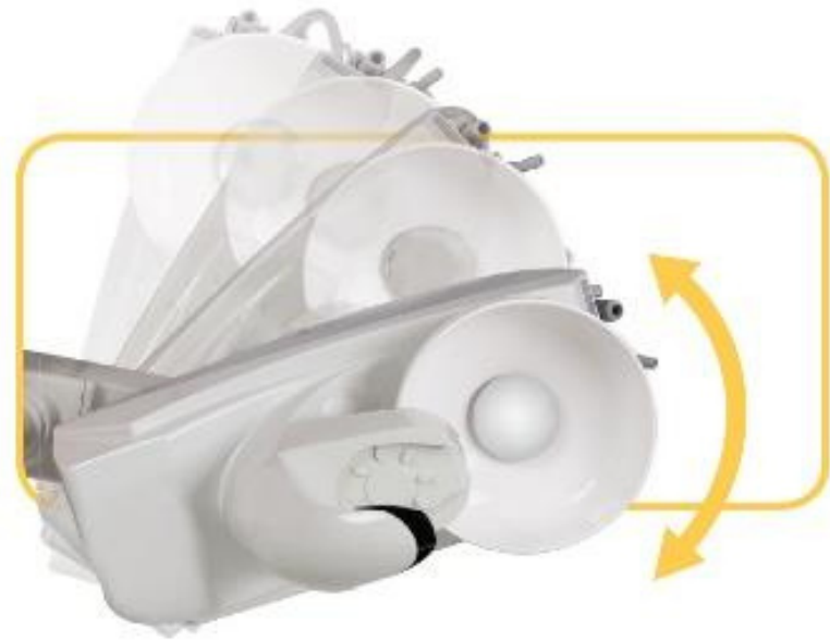
Unidad de agua plegable