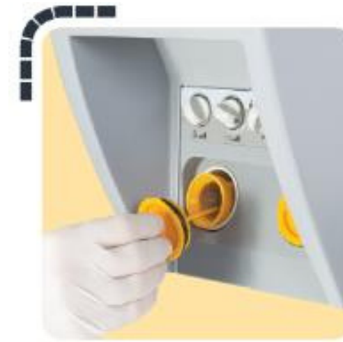
Filtro de residuos