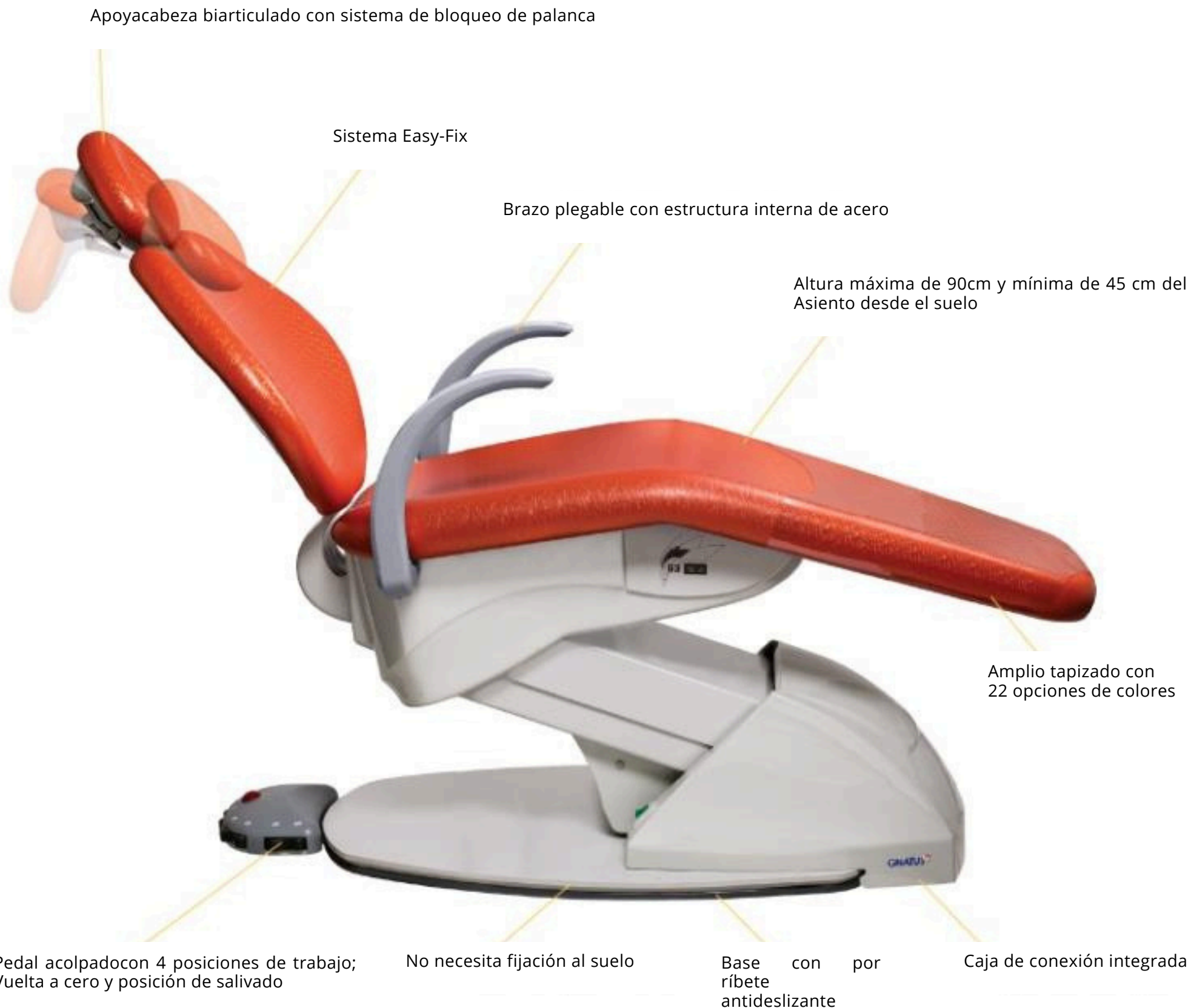
Apoyacabeza biarticulado con sistema de bloqueo de palanca