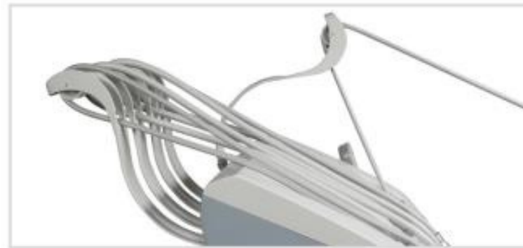
Sistema de Bloqueo de Varillas