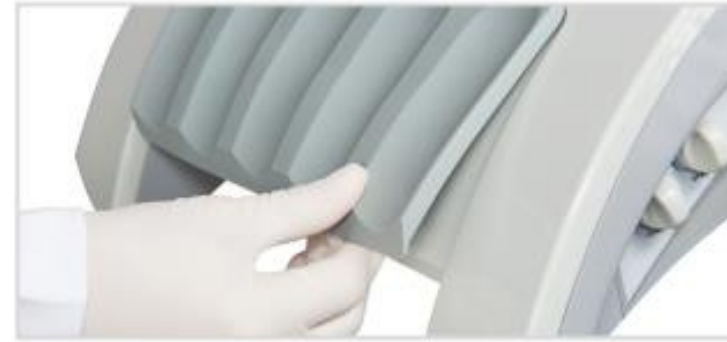
Soporte de piezas de mano extraíble