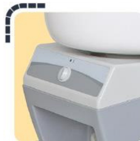
Calefacción de agua