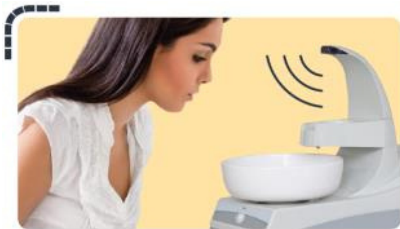
Sensor de Proximidad