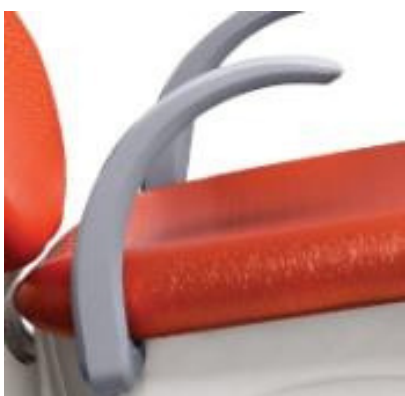
Brazo Plegable Amplio y Anatómico tapizado